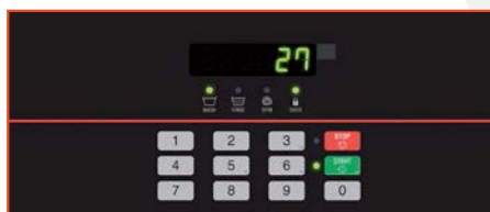
Control Quantum™ Gold