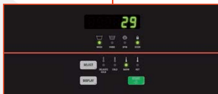
Control Quantum™ Standard